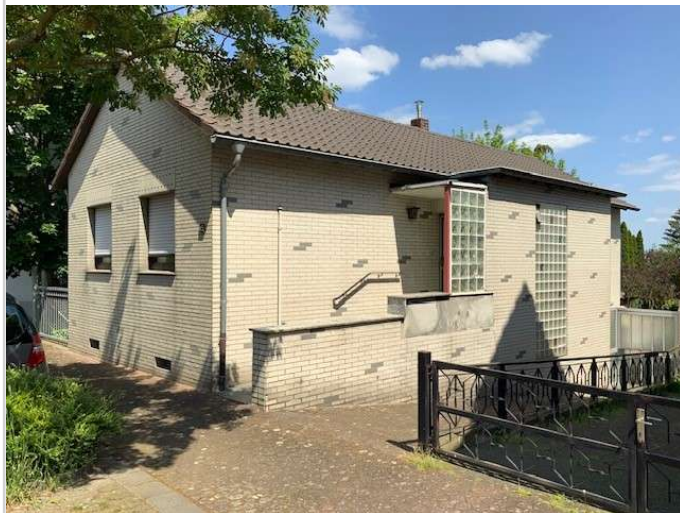
Lehnengasse_Eingang - Kopie